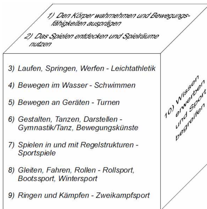
Abb. 1: Inhaltsbereiche des Schulsports 3

Diese pädagogischen Perspektiven werden in Lehrplänen der neuen Generation durch verschiedene Inhaltsbereiche umgesetzt.